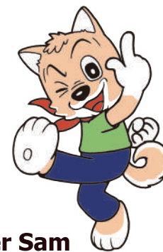
Wonder Sam Mascot of Tokyo Polytechnic University Suginami Animation Museum