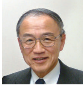
Shinichi Suzuki Director emeritus